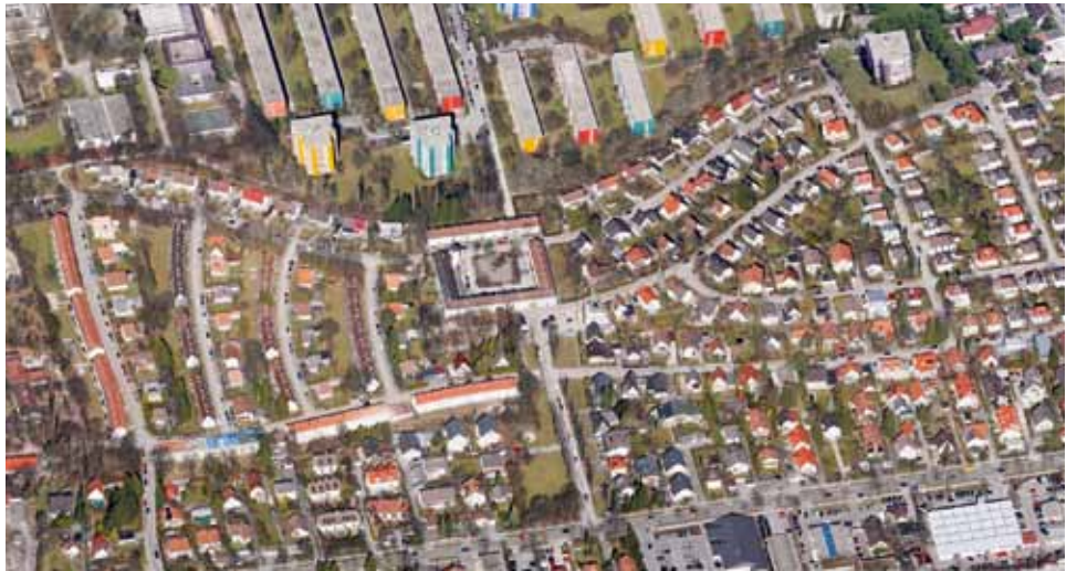
Am vollständigen Umriss ist die „Schmetterlingssiedlung“ und an den Dachfarben sind die bereits sanierten Hausreihen gut zu erkennen.