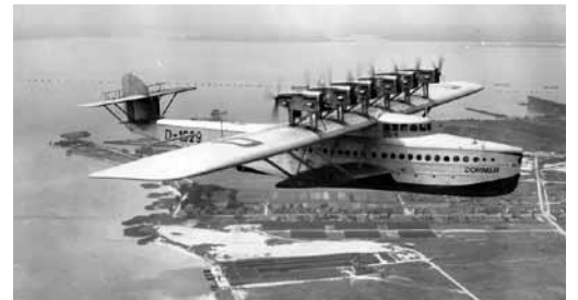
In München entwickelte und fertigte Dornier in den 1930er-Jahren legendäre Spezialflugzeuge wie etwa das sechsmotorige Wasserflugzeug DO X.